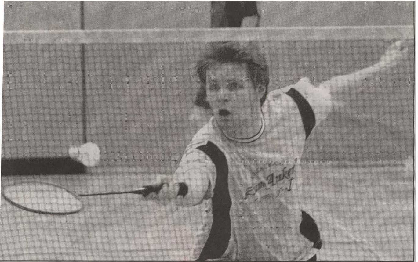
Die Spiele bei der Badminton-Stadtmeisterschaft standen auf einem hohen Niveau. Dabei kämpften die Teilnehmer bis zum Umfallen.